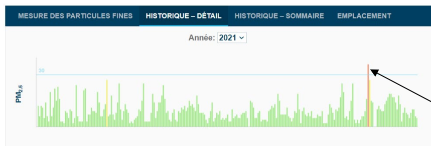
Station - 8 e Avenue, Limoilou